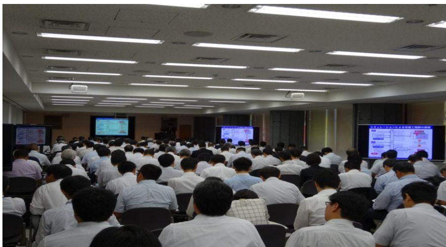
セミナー会場の全景

時期を得た話題であり生産革命につながるテーマということもあり、造船、船用機器メーカー、船級などの海事関係者の他、研究機関、商社、保険、IT/通信業界などから多数のご参加がございました。参加者からは、小組立工場のみならず他部門や他業態での適用にも関心が高く、導入要望や、さらなる展開を望む声が多く聞かれました。